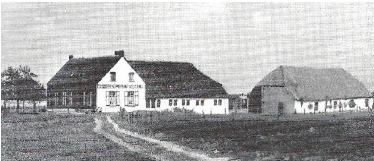
Hoeve de Schaaf ca. 1956